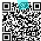
Qr-code app IOS